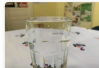
Combien de pièces peut-on mettre dans un verre rempli d'eau