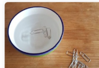
Trombone qui flotte