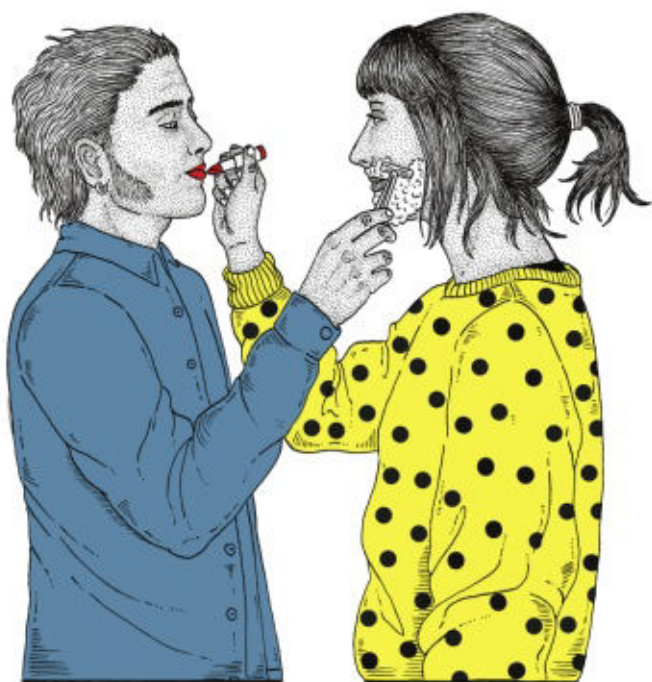
Exposition ?=+ NASU "Chacun·e son genre"